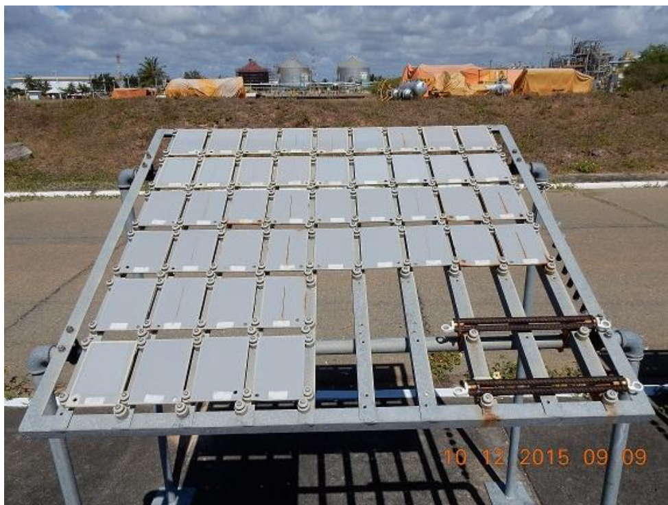
Figura 02 – Visão Geral Painel 01/Aços pintados de frente para o mar.