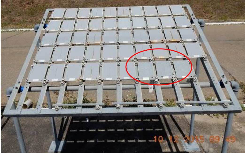
Figura 15 – Painel 03 de frente para a praia com corpos de provas em aço pintado e 03 (três) corpos de provas em aço galvanizado (no círculo vermelho).

A Figura 15 apresenta o painel 03 a 50 m da praia com corpos de provas em aço pintado e 03 (três) corpos de provas em aço galvanizado, podendo-se destacar no círculo vermelho os corpos de prova galvanizados, que não apresentaram sinais de presença de produtos de corrosão vermelha após 12 meses de exposição, bem como os corpos de prova galvanizados do painel D apresentados na Figura 16 e 17.