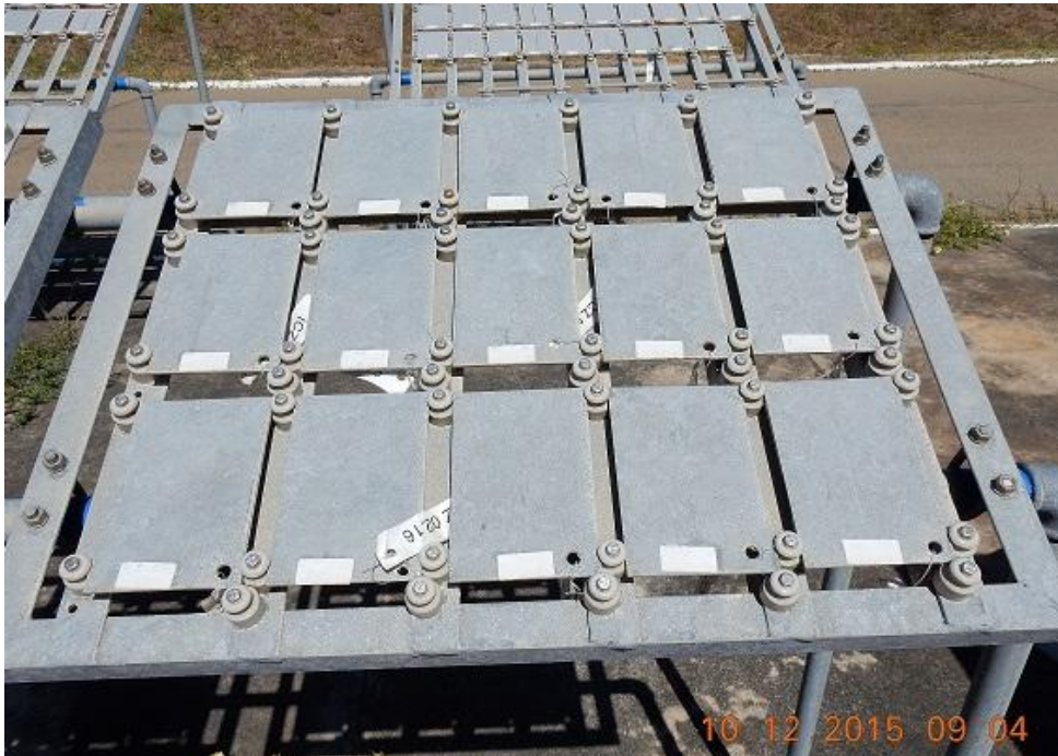
Figura 16 – Painel D a 50 m da praia com corpos de provas em aço-carbono galvanizado.