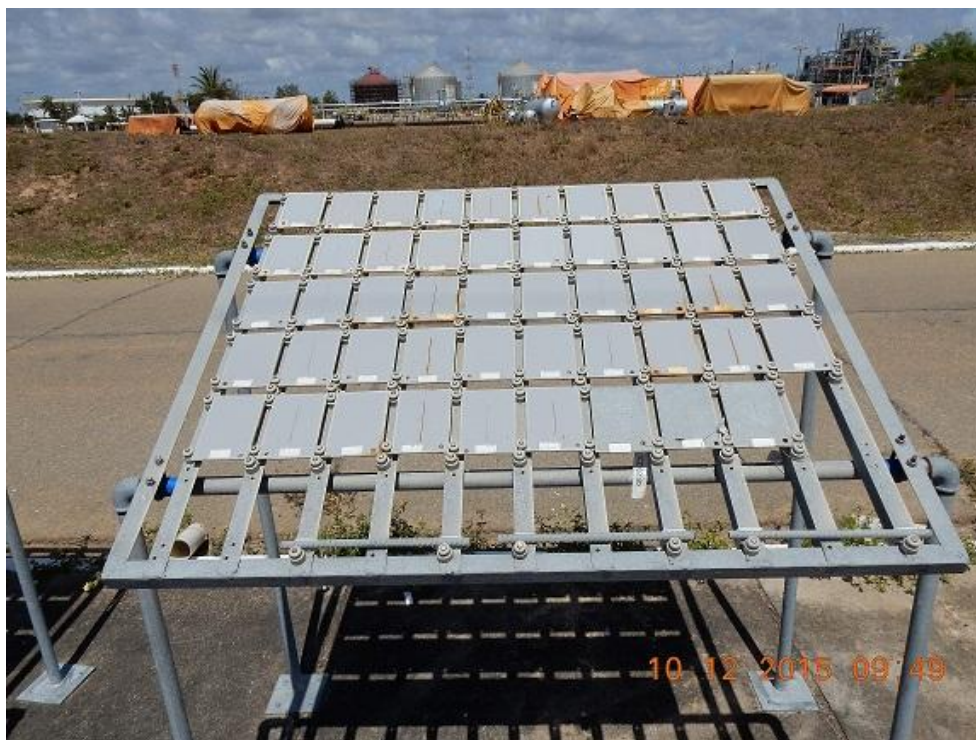
Figura 04 – Visão Geral Painel 03/Aços pintados de frente para o mar.