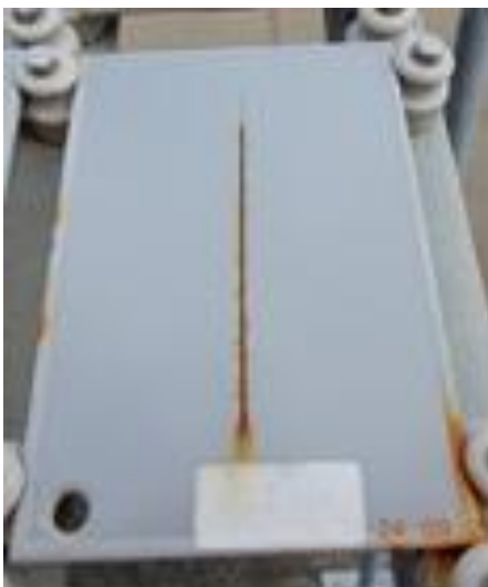
06 meses de exposição

Após doze meses de exposição os corpos de prova de aço-carbono galvanizados e pintados e com defeito se mostraram isentos de produtos de corrosão na região da incisão. Foi comprovada a superioridade do sistema galvanizado frente ao aço-carbono apenas pintado, conforme apresentado nas figuras 11 a 14, com corpos de prova com incisão neste período de doze meses de exposição.