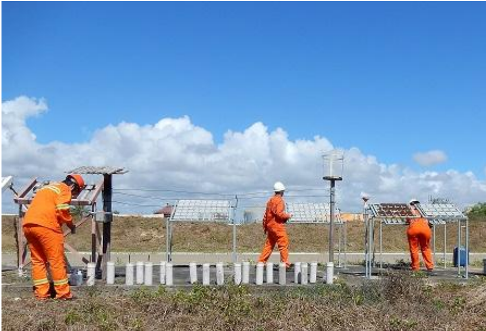
Figura 01 – Visão Geral dos corpos de provas de frente para o mar.