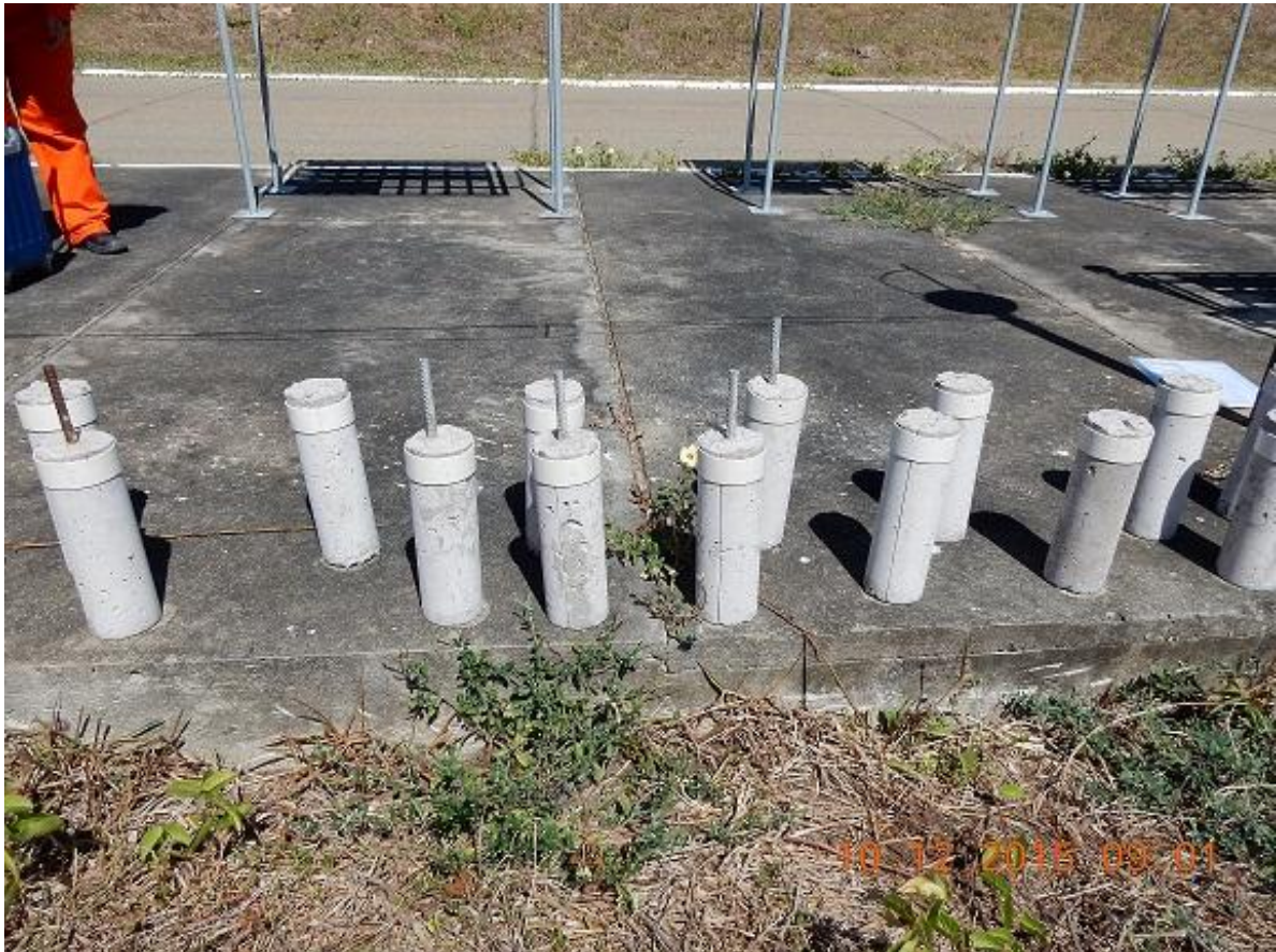
Figura 08 – Corpos de provas de vergalhões em aço galvanizado embebidos no concreto.

Neste trabalho destacamos a 4ª avaliação visual nos corpos de provas foi realizada em 10/12/15, após o período de 12 meses (instalação inicial realizada em 28/11/14). Condições Climáticas: Tempo bom com sol. Apresentamos alguns resultados realizados com seis meses de exposição apenas como referência.