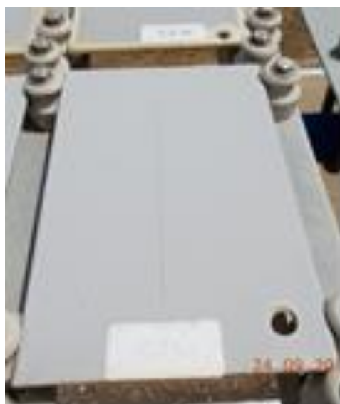
Figura 12 – Aço-carbono pintado (tinta base aquosa – corpo de prova ICZ26);