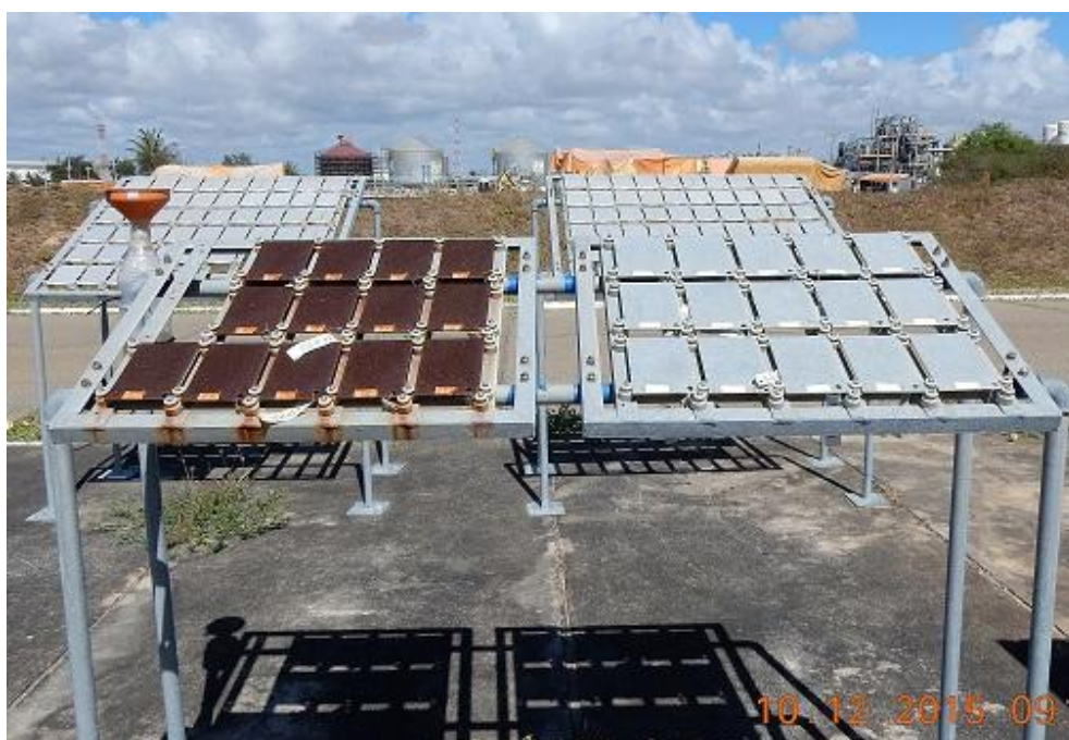
Figura 05 – Visão Geral Painéis B e D/Aços-carbono e galvanizados de frente para o mar.