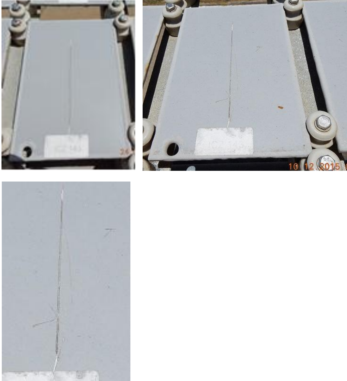
Figura 14 – Aço-carbono galvanizado pintado (tinta epóxi Damp Tolerant) com pré-tratamento à base sulfossilanos – corpo de prova ICZ 143.

Destacamos ainda que na finalização dos ensaios, previstos para o mês de dezembro/2016, serão realizados nos corpos de prova de aço pintados e nos galvanizados pintados, testes de aderência por tração (pull-off) segundo a norma ISO 4624 e penetração de corrosão nos entalhes segundo a norma ASTM D 1654, determinação de bolhas segundo a norma ASTM D 714 ou ISO 4628 – 2 e ocorrência de ferrugem segundo ASTM D 610.