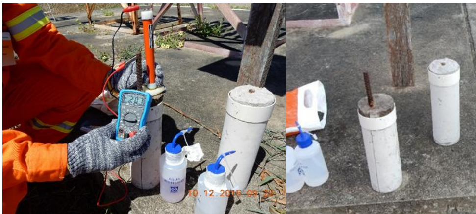
Figura 19 – Vergalhão preto embebido no concreto.