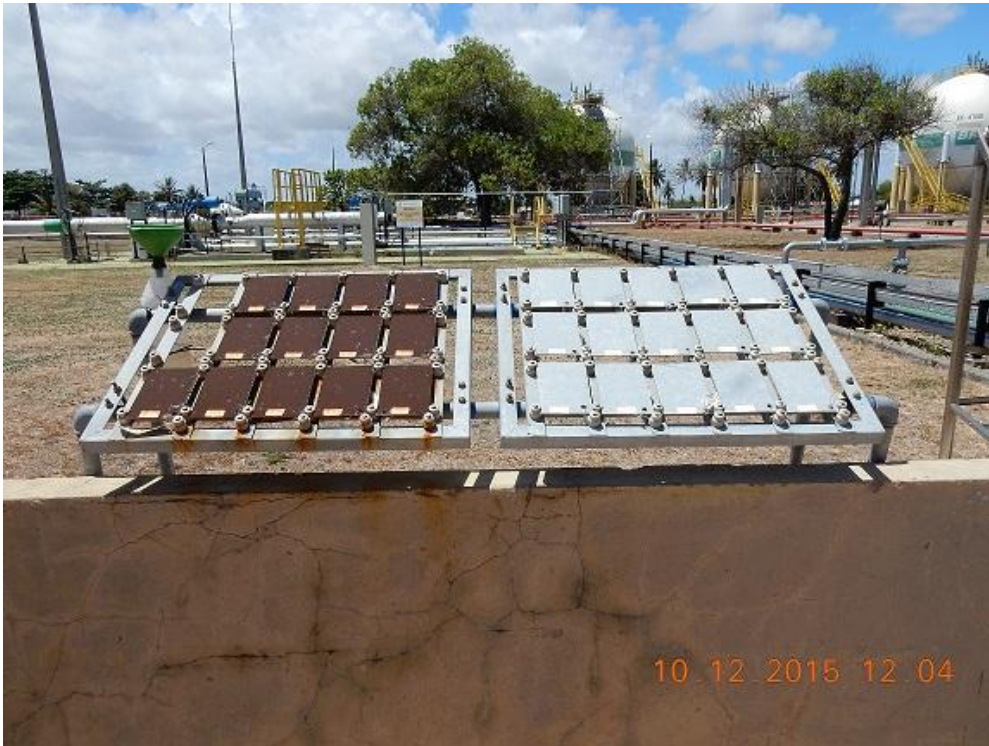
Figura 06 – Visão Geral Painéis A e C/Aços carbono e galvanizados a 500 m da praia, na região da UPGN.