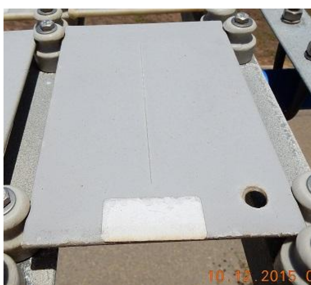
Figura 13 – Aço-carbono galvanizado pintado (tinta eletrostática a pó – corpo de prova ICZ65);