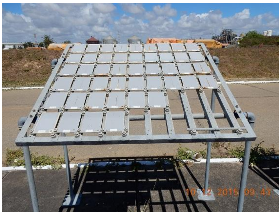
Figura 03 – Visão Geral Painel 02/Aços pintados de frente para o mar.