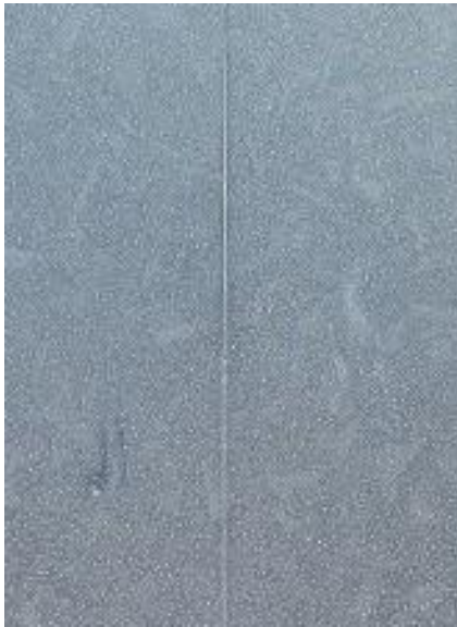
06 meses de exposição