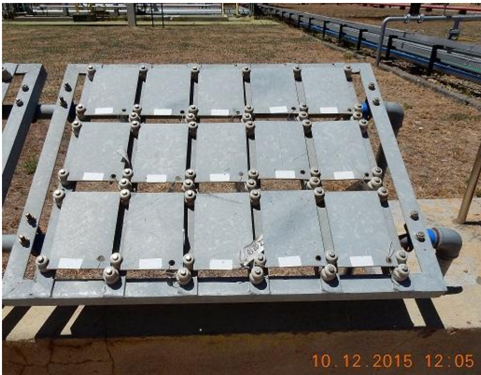
Figura 17 – Painel C a 500 m da praia, na região denominada UPGN - Unidade de Processamento de Gás Natural, com corpos de provas em aço-carbono galvanizado.