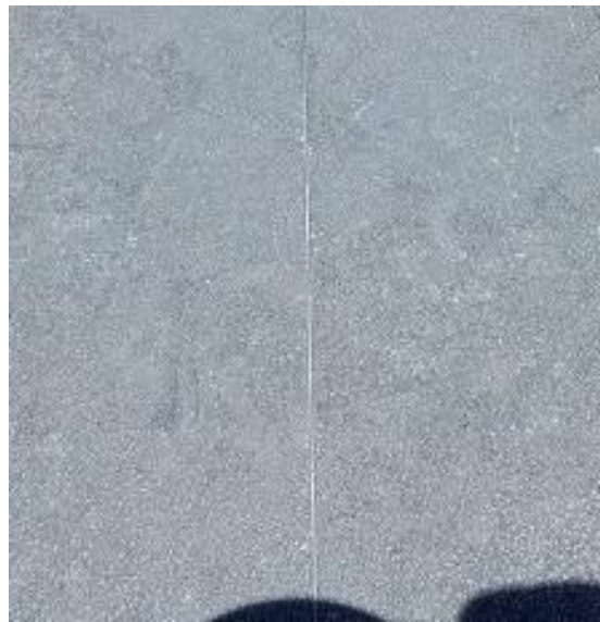
12 meses de exposição