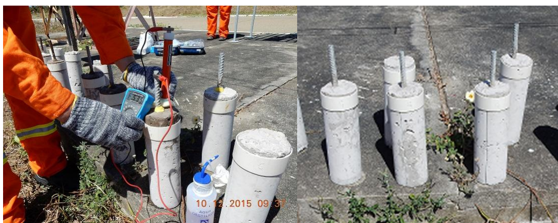
Figura 18 – Vergalhão galvanizado por imersão a quente embebido no concreto.

Observa-se que com o passar do tempo os valores ficaram mais positivos, indicando o estado passivo do aço embebido em concreto. O mesmo ocorreu para os vergalhões de aço galvanizado, indicando que estes também se passivaram no concreto.