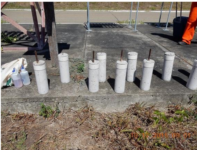
Figura 07 – Corpos de provas de vergalhões em aço “preto” (sem galvanização) embebidos no concreto.