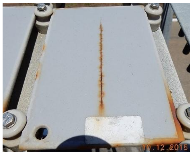
12 meses de exposição